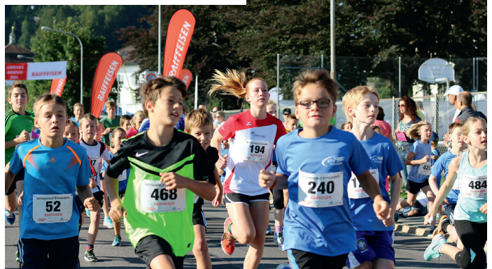
Bewegen macht allen Spass...