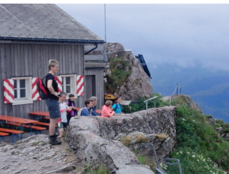
Laufträff auf den Grossen Mythen