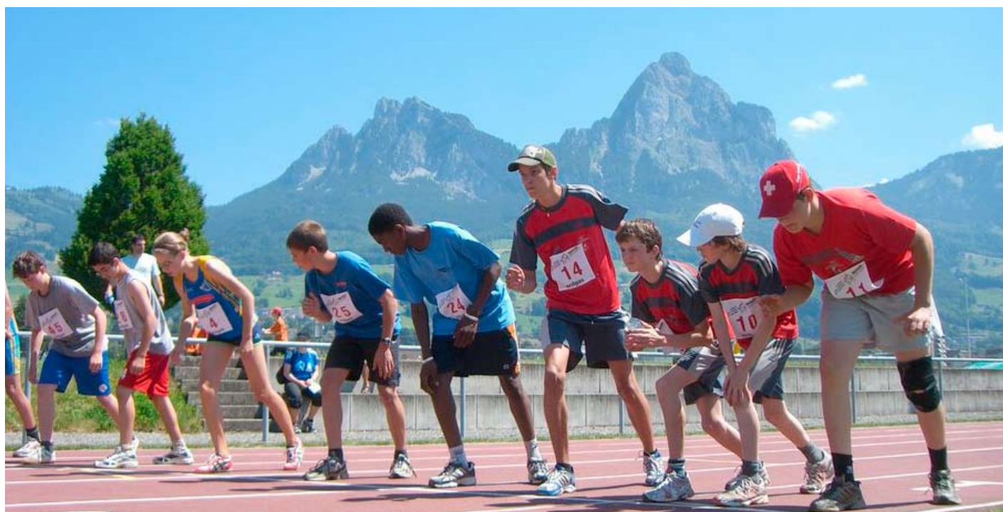
Prächtige Kulisse um die Sportanlage Wintersried.