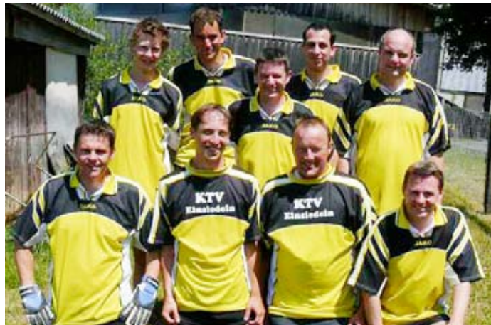
Das siegreiche KTV-Team am Einsiedler Dorfturnier.

Auf Messers Schneide stand auch die Finalpartie am Einsiedler-Plauschgrüpfi. Nebst Fussball wurde hier Dart gespielt. Die Entscheidung fiel aber beim Jassen,