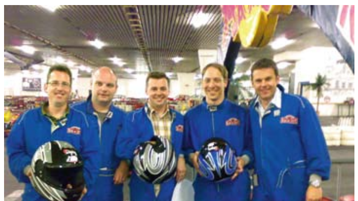
Kart-Bahn Roggwil: Hier wurde um jeden Rang gekämpft.

Zögerlich ging's auf die erste Kurve los. Doch schon bald wurden die Hemmungen fallengelassen und auch mal ein Crash in Kauf genommen. Viel zu schnell waren die Runden zu Ende, deshalb wurde gleich nochmals nachbezahlt. Ein gelungener Ausflug fand so sein Ende – die Jugileiter sind bereit für neue Taten. bsch