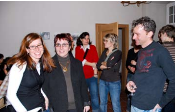
Vor der GV fand ein ungezwungener Apéro statt.