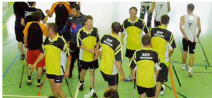
Shakehands nach gewonnenem Spiel.