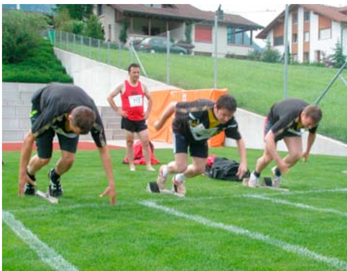
80-m-Lauf: Schon am Start wurden 100-tel gewonnen oder verloren.