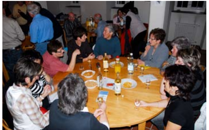
Die Damen «tagten» am runden Tisch.