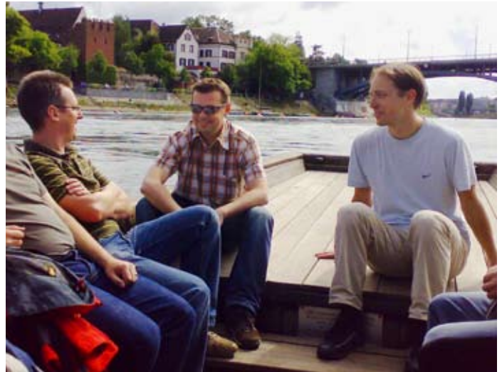
Gemütlicher Morgen in Basel: Relaxe Stimmung auf dem Rhein.