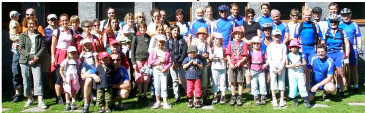
Grossartige Drittaufgabe: 50 KTVler genossen Sonne und Regen in der Bündner Bergwelt. Ein ausführlicher Bericht folgt im nächsten «News».