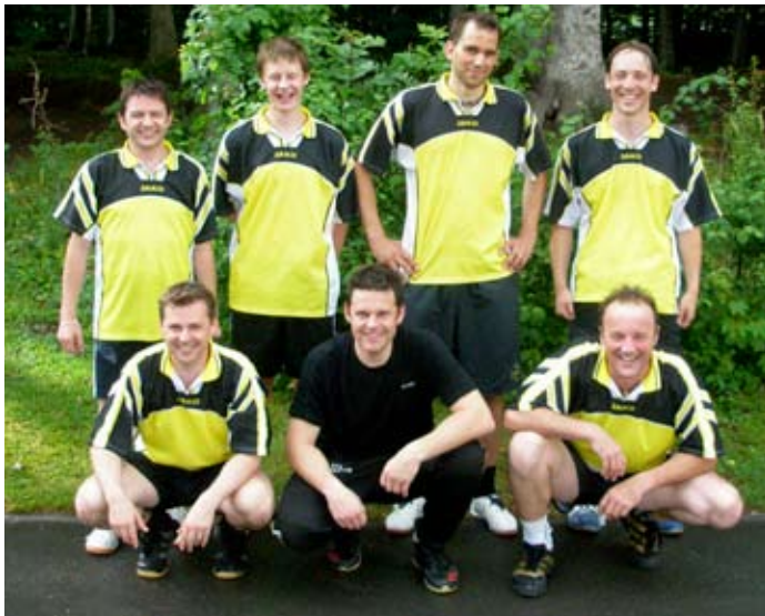
Sie vertraten den KTV Einsiedeln am Sportfest.