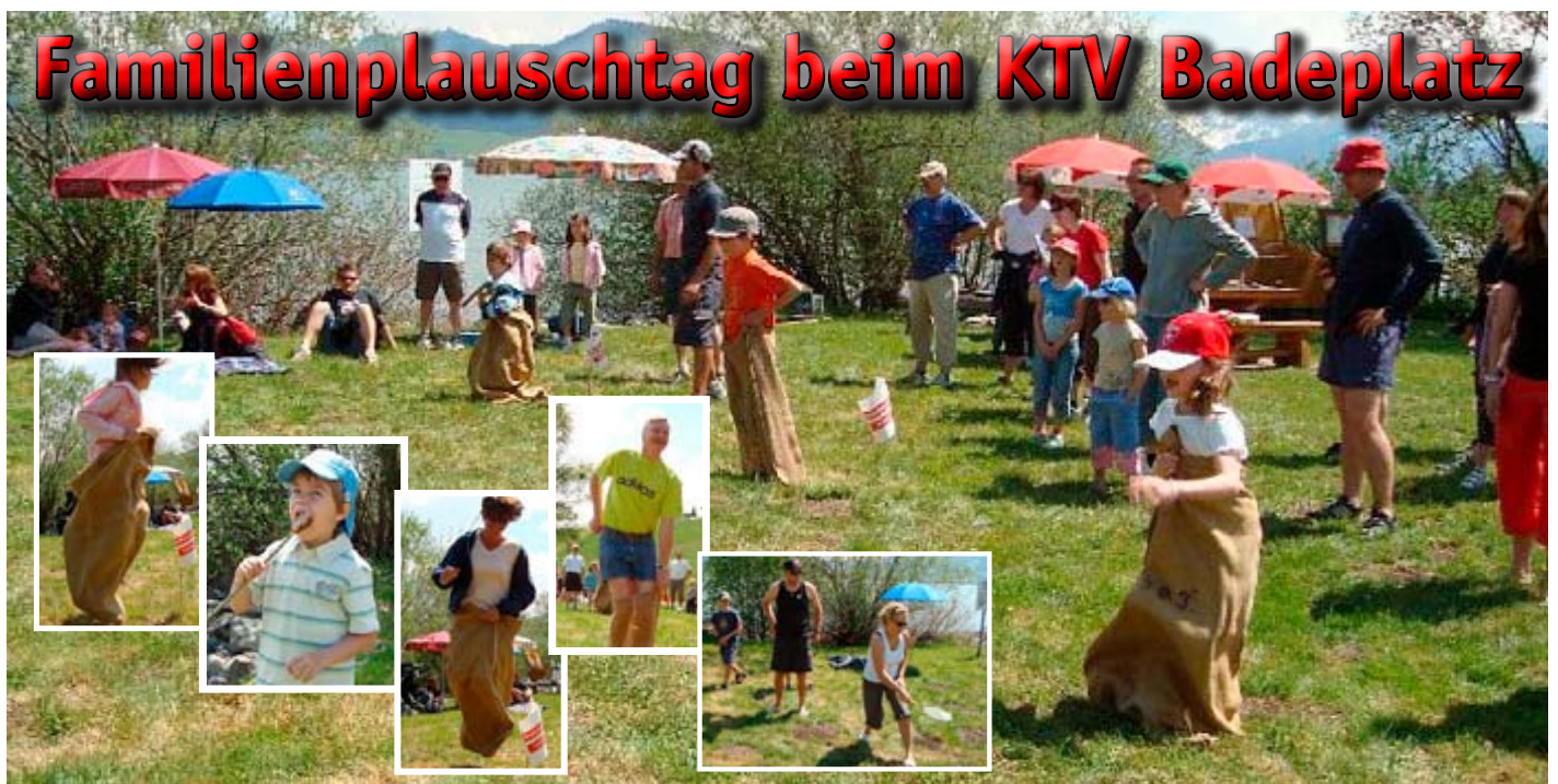
Sackhüpfen liess den Puls von Gross und Klein in die Höhe schnellen. Der sonnige Tag war ideal für einen Grillplausch.