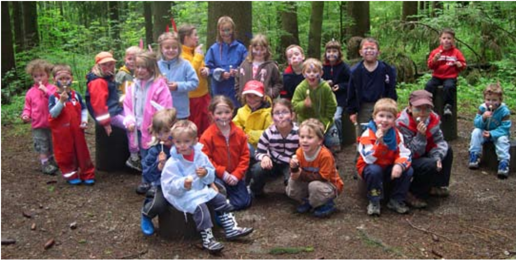
Auch das ist MuKi-Turnen: Spielen im Wald.