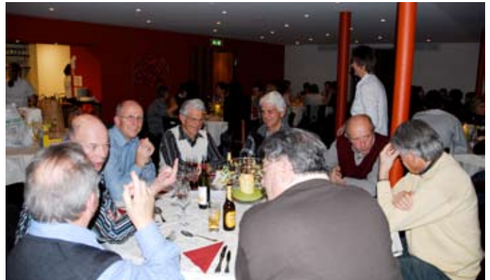
Vor dem Nachtessen im Hotel Drei Könige blieb Zeit für Gespräche.