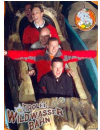
Im Europa-Park ging's «feuchtfröhlich» zu und her.

Um die Kameradschaft zu fördern und als Motivations-Spritze für weitere Einsätze als Jugendriegenleiter war ein Ausflug auf das Jungfrauoch geplant. Aber des schlechten Mai-Wetters wegen musste ein Ersatzprogramm her. Also vergnügten sich die fünf Männer am Samstag im Europapark in Rust. Wie im Flug verging die Zeit. Den krönenden Abschluss bildete die Fahrt auf der «Silverstar». In Basel gab's dann Abendessen. Hier wurde auch gleich übernachtet. Am nächsten Morgen war herrliches Wetter. Ein leckeres Frühstück und ein gemütlicher Stadtbummel läuteten den Sonntag ein. Auf der Kart-Bahn in Roggwil war's dann vorbei mit der Gemütlichkeit. Schneller als den Kart-Neulingen lieb, sassen sie schon ohne jegliche Instruktion in Ihren Boliden. Die Startflagge wurde gewinkt und los ging die Fahrt.